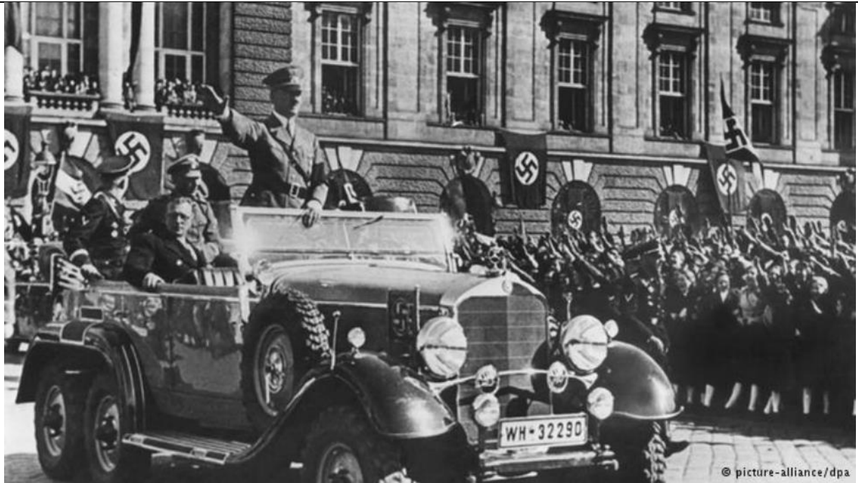
Hitler incorpora a Austria a la Alemania Nazi (12 de marzo de 1938)

Hitler anexó Austria en 1938, en medio del delirio de la mayoría de la población que en un plebiscito ratificó la unión. Luego fue Checoslovaquia que en gran parte había pertenecido a Alemania hasta la Primera Guerra Mundial. Por su parte Italia había conquistado Etiopía en África y Albania en Europa, y el Japón hacía lo propio con Manchuria e iniciaba la invasión de