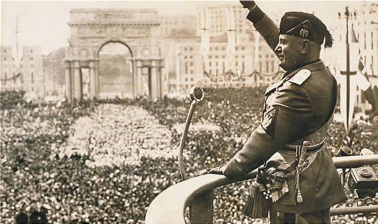
Benito Mussolini dando un discurso ante una multitud fascista en Génova, Italia. 1930

En Italia había descontento porque sus ganancias territoriales en el conflicto de 1914 habían sido mínimas; más de medio millón de personas, casi todos ex soldados de la contienda, estaban sin empleo; los comunistas provocaban huelgas y atentados terroristas. El Rey Víctor Manuel III y sus ministros eran incapaces de remediar la situación. En esta circunstancia surgió el líder Benito Mussolini , ex socialista, cuyo partido se denominó fascismo porque su símbolo eran las fasces que portaban los guardias de los cónsules en la Antigua Roma. Los fascistas se uniformaron con camisetas negras, se organizaron en milicias, disolvieron por la fuerza a los comunistas y socialistas y clamaron por el establecimiento de un gobierno unipersonal y fuerte, que lograra la paz y el bienestar. Muchos burgueses capitalistas apoyaron el movimiento por ser anticomunista.