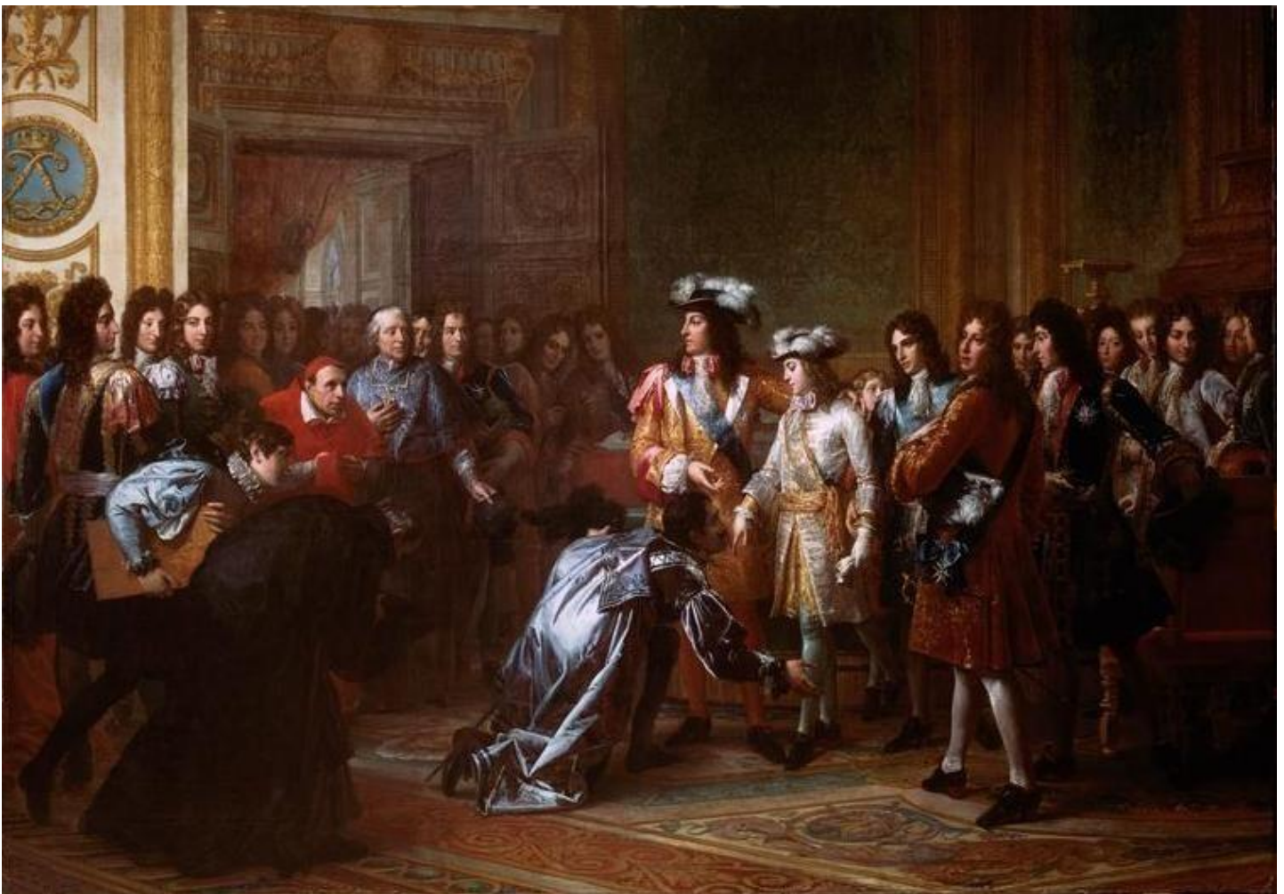
Proclamación de Felipe V como Rey de España en el Palacio de Versalles (Francia) el 16 de noviembre de 1700. (cuadro de François Pascal Simon Gérard).

Por su parte, el absolutismo postulaba que el poder de los reyes viene directamente de Dios y, por lo tanto, estos no tienen que responder por sus actos frente a sus súbditos. La unión de estas dos formas de pensamiento se explica por la necesidad que tenían ambas de un Estado fuerte y centralizado .