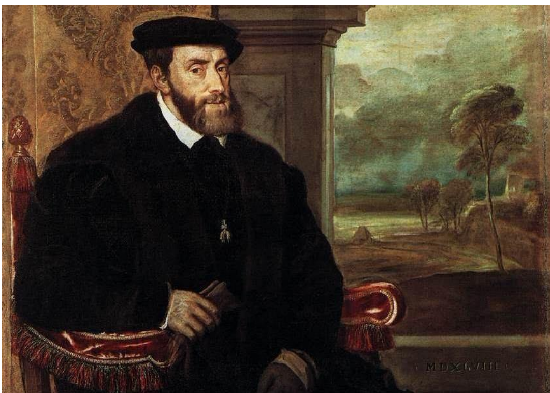
Retrato de Carlos I (Tiziano, c. 1548). En 1516, Carlos I asumió el trono español. Fue el primer rey de la dinastía de los Habsburgo. Durante su reinado, los conquistadores españoles dominaron los territorios americanos desde México hasta el estrecho de Magallanes y establecieron soberanía en Filipinas y en las islas Marianas. Como Carlos V de Alemania , heredó los territorios que incluían los Países Bajos, Nápoles y Sicilia.

Por haberse donado por el Papa Alejandro VI las tierras de América a la corona de Castilla (Bula Intercaetera, 1493) y no al pueblo español, las indias mantuvieron su personalidad propia y constituyeron una entidad política distinta de la metrópoli. El Rey común era el nexo que a unía a ambas. Las indias se consideraban así, no colonias, sino reinos o provincias constitutivas de una monarquía especial, la “monarquía indiana”, ligada a España por la unión personal del Rey.