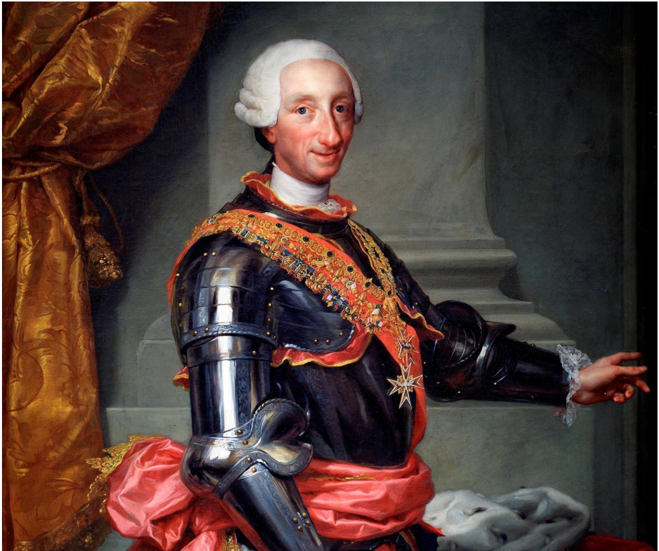
Retrato de Carlos III de Borbón (Mengs, 1761). Rey de España desde 1759 a 1788, fiel representante del Despotismo Ilustrado, realizó las principales reformas administrativas y comerciales del siglo XVIII.

Con el objetivo de retomar el control de las colonias, la Corona hizo valer, en el marco de las reformas borbónicas, el Patronato Real, lo que se denominó regalismo . Entre las medidas que adoptó, estuvo la expulsión de la orden religiosa jesuita de los dominios del rey en 1767 y la confiscación de todos sus bienes. Esta orden había alcanzado un alto grado de importancia política en América, además de haber acumulado cuantiosas posesiones durante los siglos coloniales. Fueron acusados de deslealtad a la Corona y de anteponer los intereses del Vaticano a los del Imperio, así como de incentivar motines y rebeliones en España. El problema de fondo era, sin embargo, la rivalidad entre el poder absoluto de los Borbones y la Iglesia, que reclamaba su derecho a nombrar a sus autoridades.